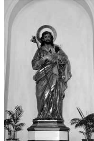
SAN JOSÉ IGLESIA PARROQUIAL DE JAVALÍ VIEJO